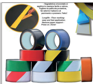
STAMPA GRAFICA SU PIASTRELLA SEGNALETICA ORIZZONTALE